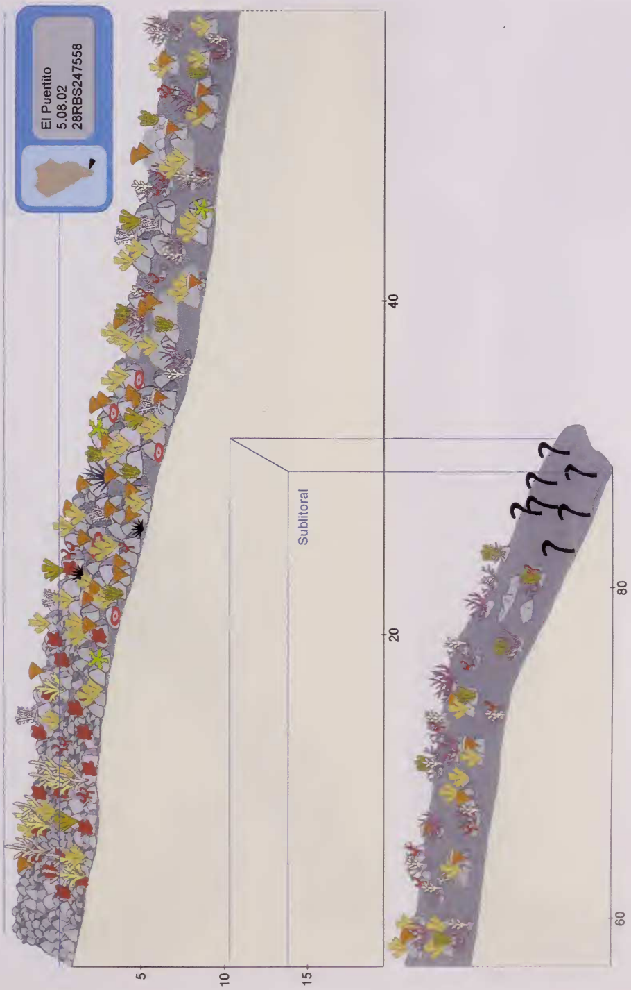
Fig. 4. El Puertito. Esquema del perfil del litoral con la zonación de las especies dominantes.